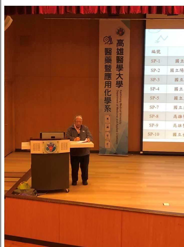
圖說明：陳長謙院士發表閉幕演講